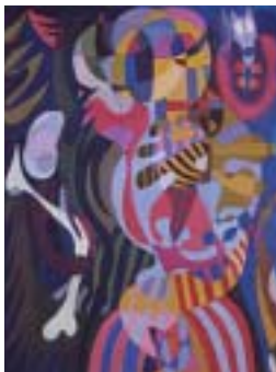
Gudinden fra Hølkadalen af Richard Mortensen, 1935. (Bornholms Kunstmuseum)

Tilmelding senest 15. maj ved indbetaling af kr. 550 til foreningens konto 1471-1033220. Evt. giroindbetalingskort kan hentes på Jernbaneplassen. – HUSK at opgive navn(e) og alder (af hensyn til evt. pensionstrabatter).