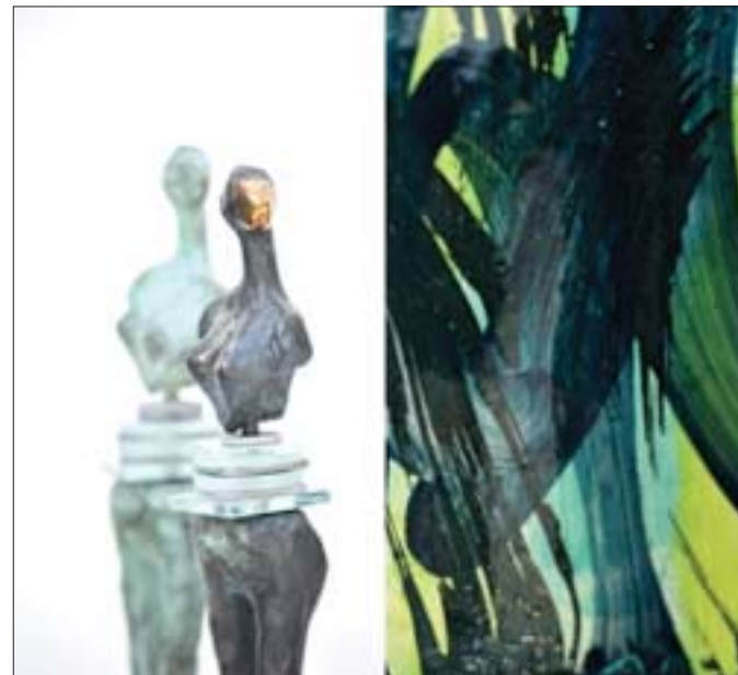
"Miroir de l'âme" (Sjælens spejl)