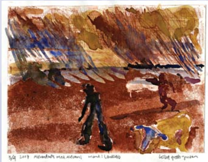
Lisbet Groth-Jensen: Mand i landskab. Akvatinte