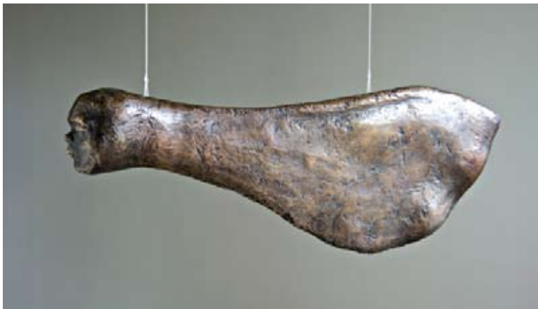
Vibeke Glarbo: Bodil nyfødt.

"ROSA MUNDI (verdens rose) er en ældgammel rose, som allerede optræder i Danmark i middelalderen. Den er livskraftig og hårdfør, formerer sig ved rodskud og kan tåle at blive klippet med en hækkesaks.