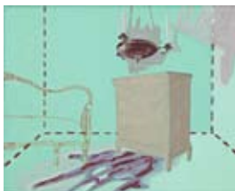
Helle Frøsig: Grønt rum

På væggen overfor er en tæt ophængning af billeder af vidt forskellige størrelser og medier: malerier, tegninger, grafiske tryk, deкупør – udskårne plader, fotos etc. Alle billeder visualiserer rum, som er møblerede, overfyldte eller tomme, med eller uden døre og vinduer.