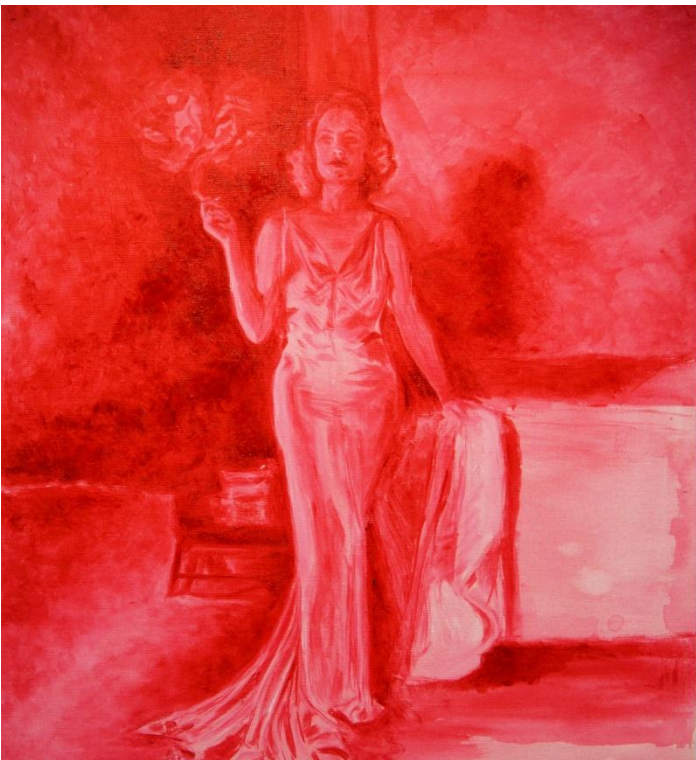
Pink Lady (2023)